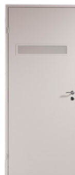
Slät vit med glas