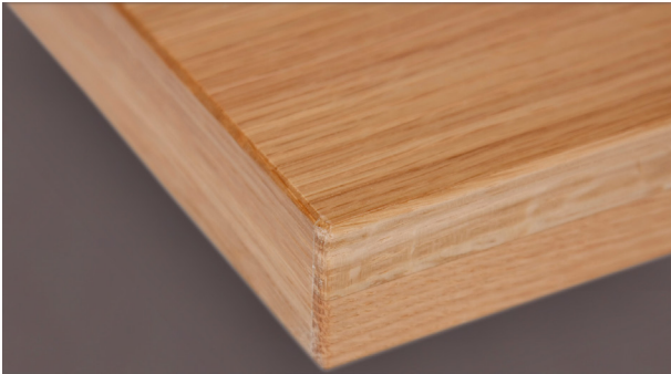
Detalj kantlist, slät ekdörr.

Kika närmare på bilderna! www.bengtssonssnickeri.se