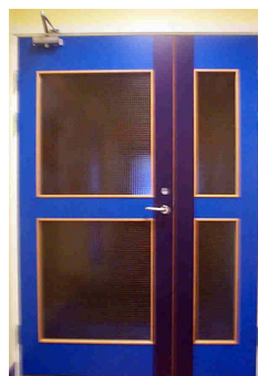
Pardörr med glas och mönsterlagd laminat